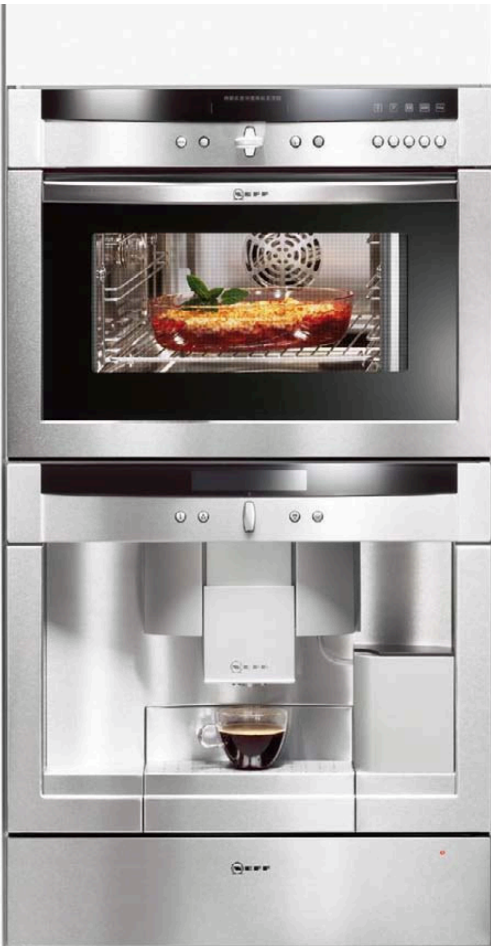
Horno de vapor CircoSteam® C 47C42 N0 + cafetera C 77V60 N01 + módulo de calentamiento N 21H45 N0