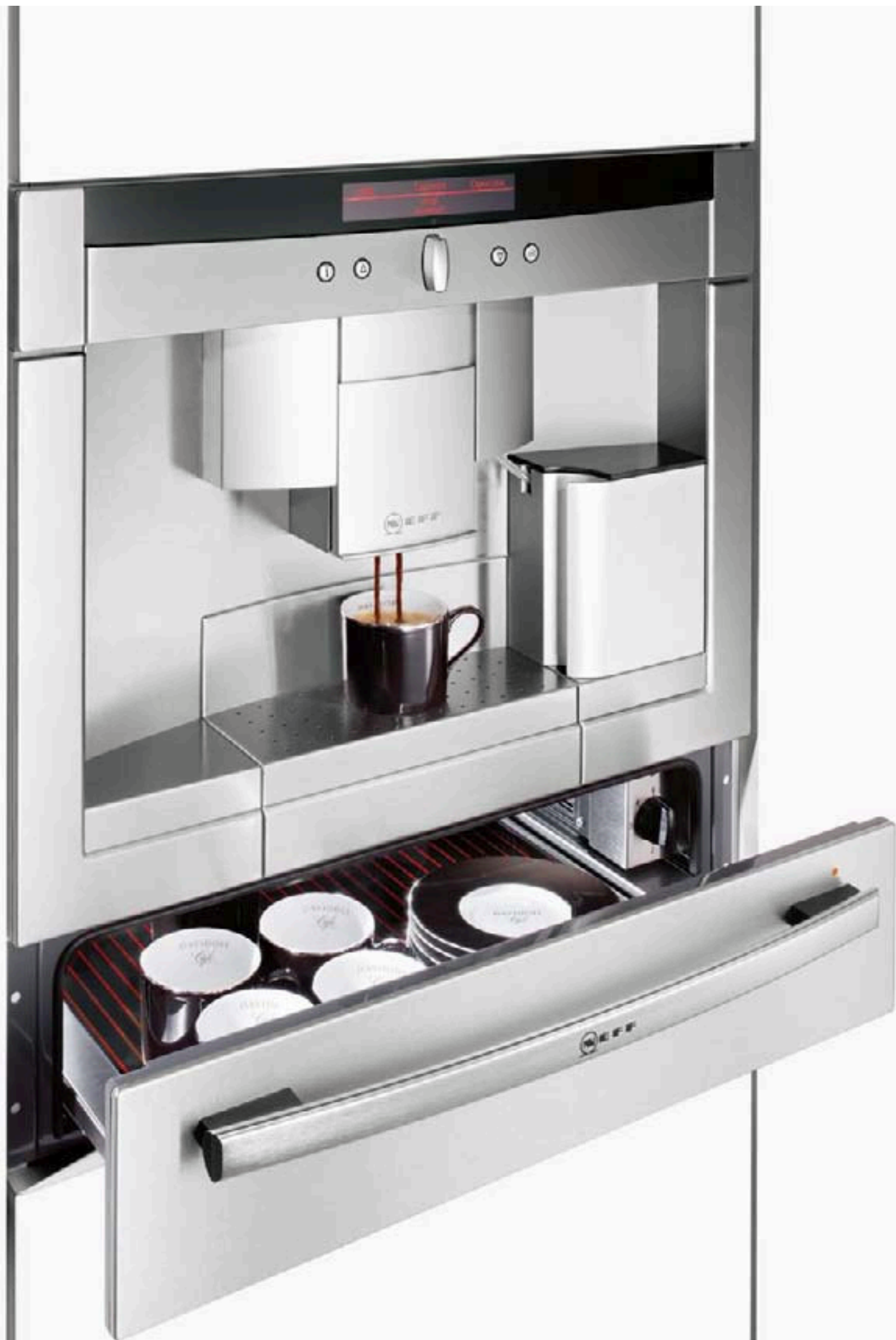
Cafetera C 77V60 N01 + módulo profesional de calentamiento N 21H40 N0